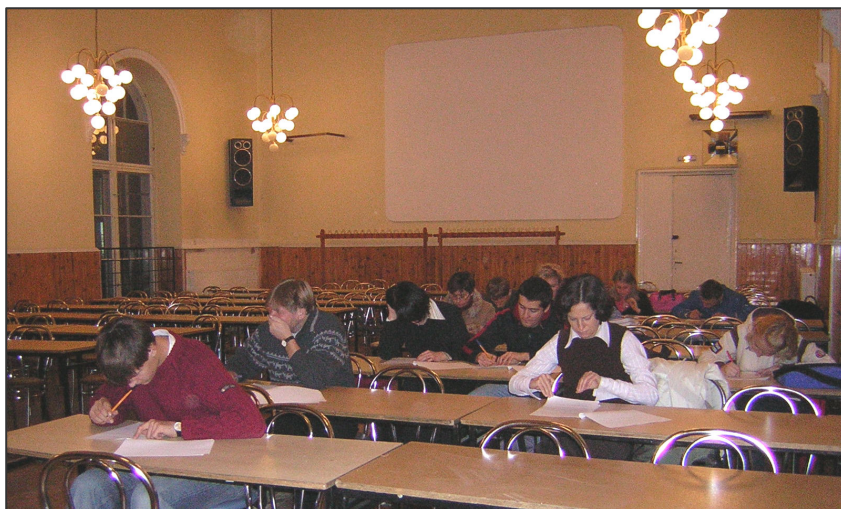
Kursanci podczas wypełniania ankiet