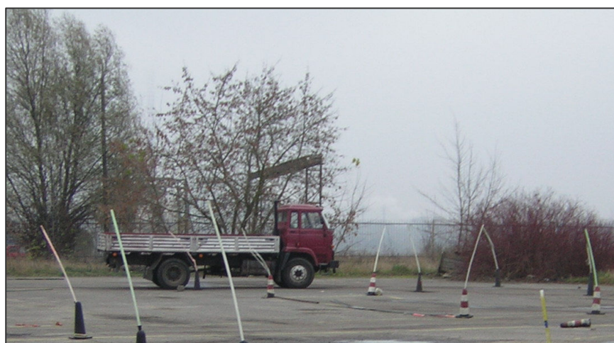
Pojazdy szkoleniowe na placach manewrowych